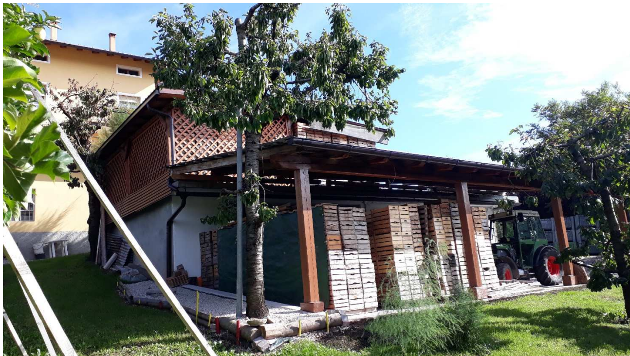
Vista da nord